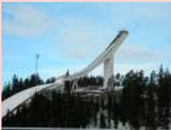
Holmenkollen ski jump in Oslo